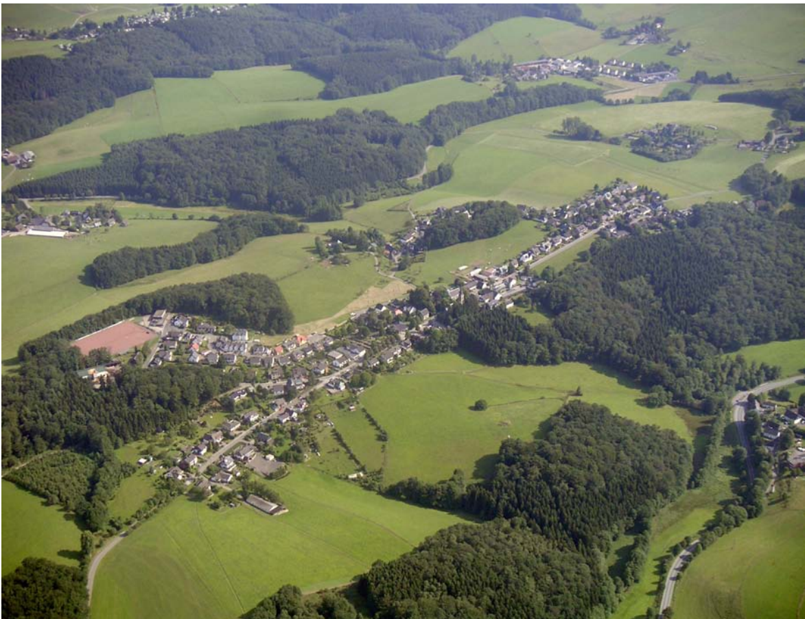
Straßendorf mit Weilern