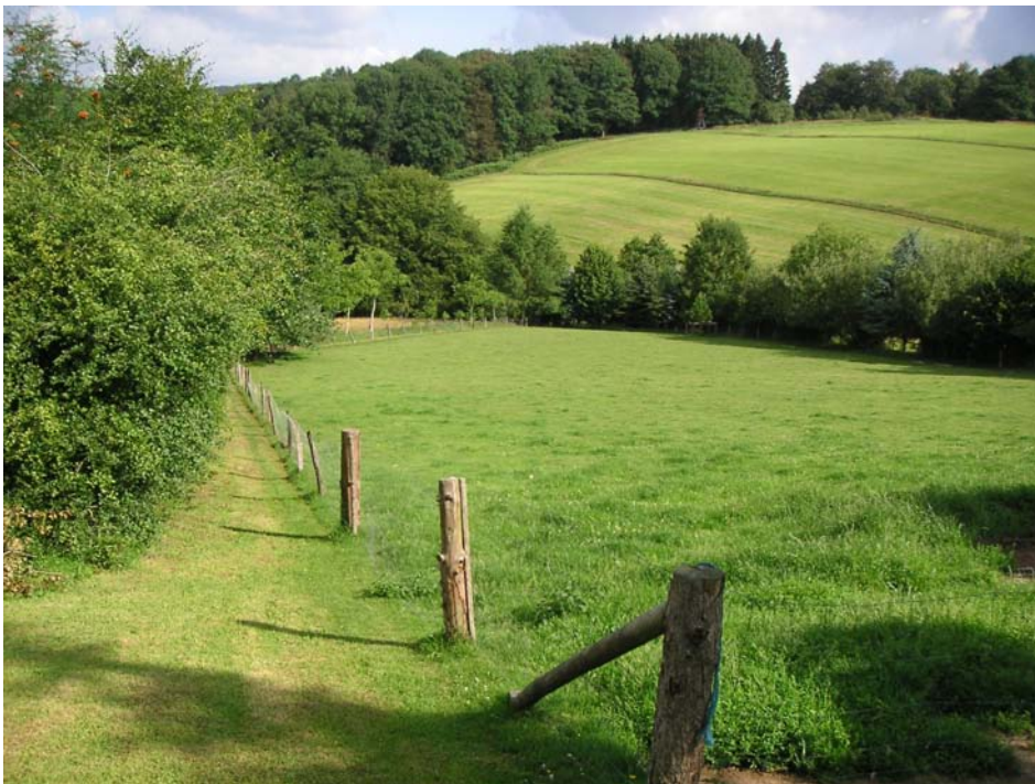
Schafsweide mit Feldgehölzen