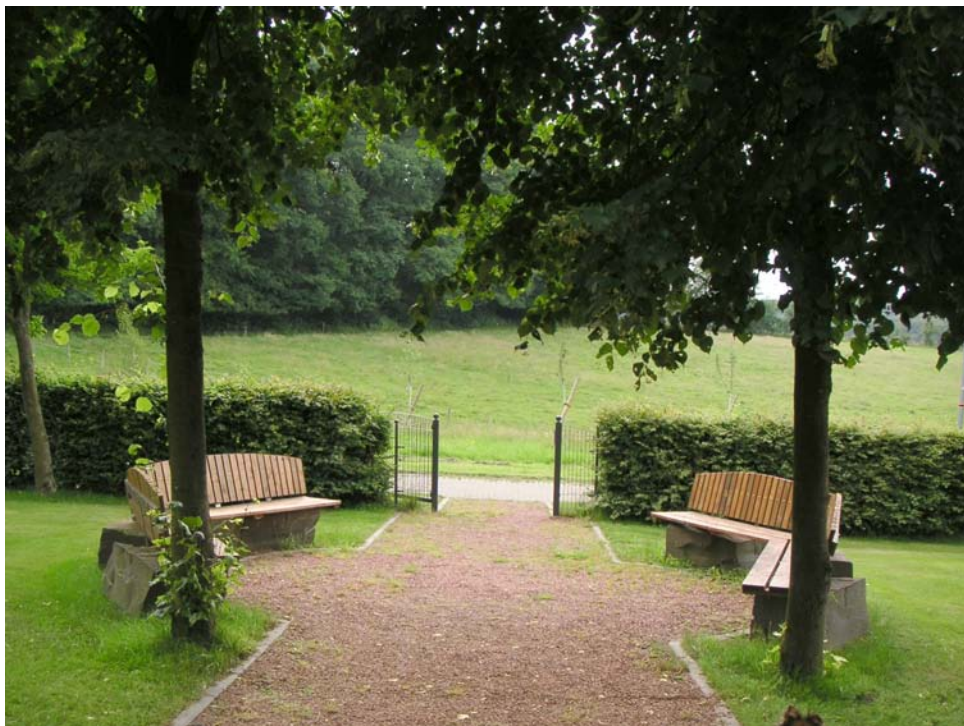
Friedhof: neue Sitzgruppe mit Weg und fußläufigem Tor